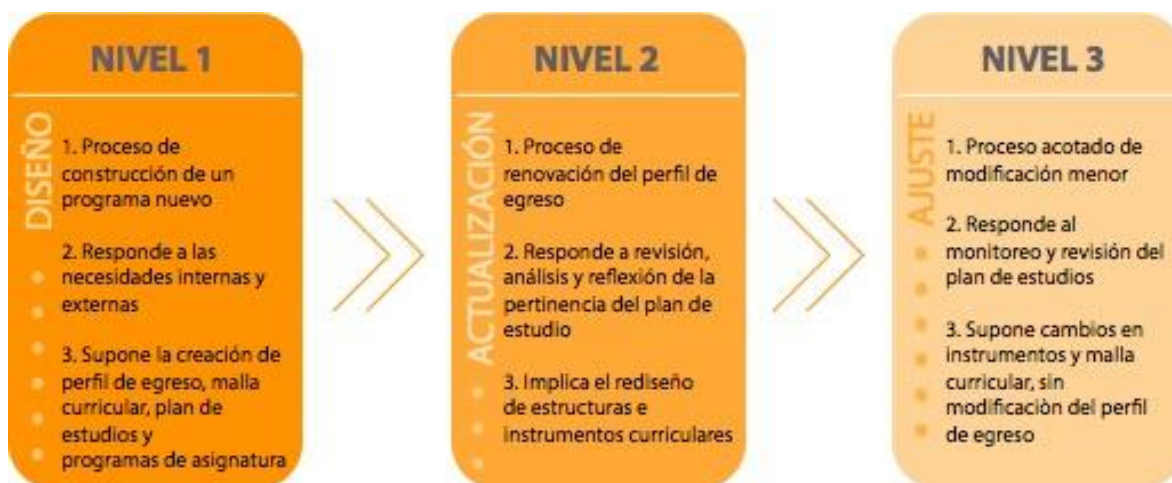
Figura N°1: Niveles de Innovación Curricular

Para mantener la vigencia de la oferta formativa, resulta necesario que se realicen de forma regular, modificaciones curriculares mayores y menores a nuestros planes de estudio. Se define como una modificación mayor, un cambio sustantivo en el perfil de egreso de la carrera y por ende en el itinerario formativo que conduce ha dicho perfil. Por su parte, una modificación menor se entiende como un ajuste al perfil de egreso y plan de estudios que no afecta o implica modificaciones sustantivas, su propósito consiste en ajustar el plan de estudio y asignaturas para mantenerlas actualizadas, conforme la evidencia surgida en las evaluaciones de la progresión de estudios, prácticas laborales, y producto de los análisis de los resultados del proceso formativo.